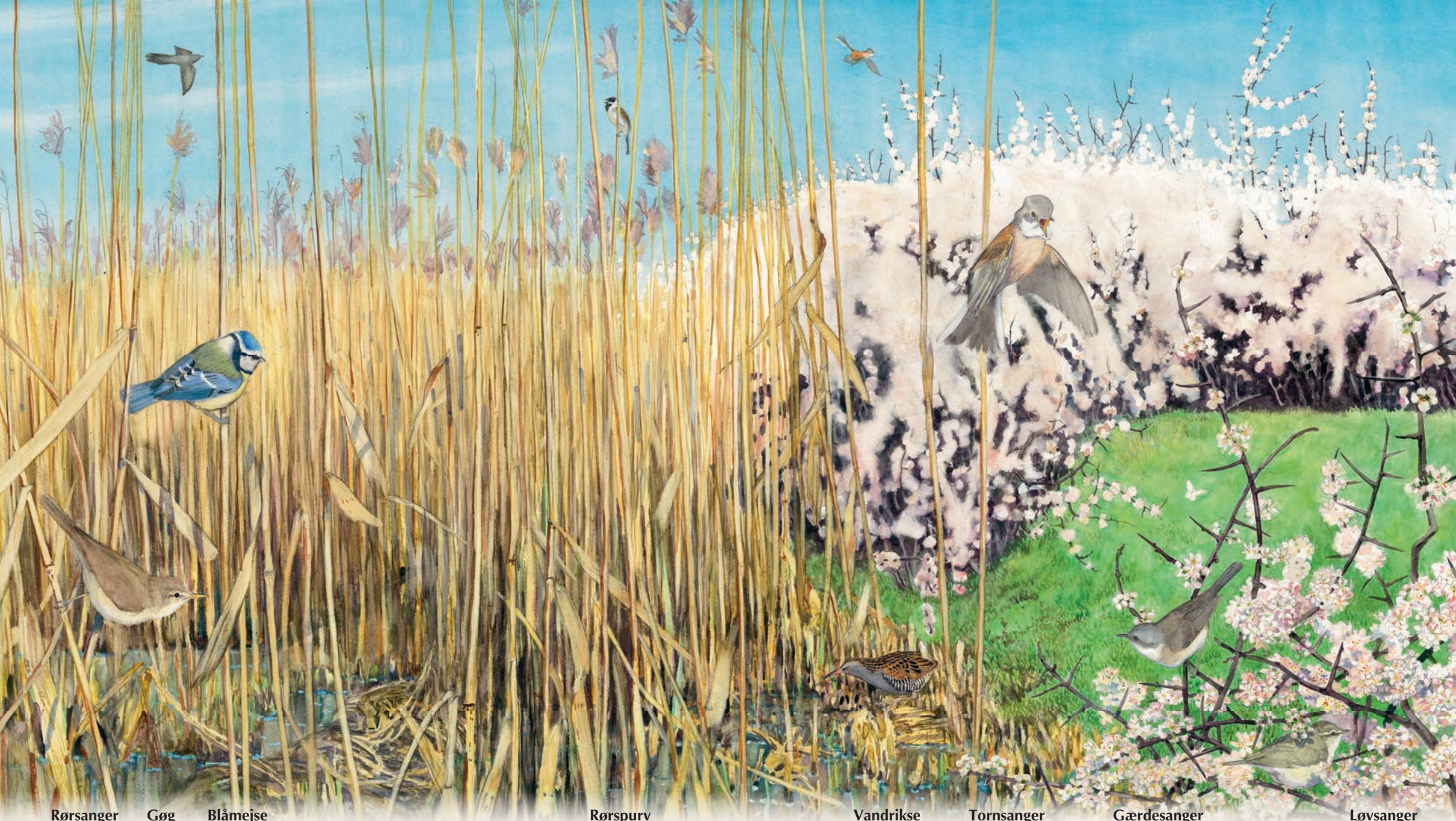
Rørsanger Gøg Blåmejsje